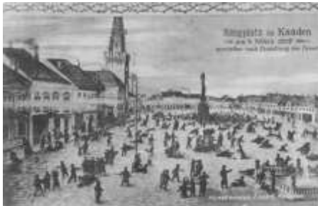
Der 4. März 1919 in Kaaden!

Die Ereignisse des 4. März 1919 darf man nicht isoliert sehen. Vorausgegangen war der Waffenstillstand vom 11.11.1918 mit 23 Artikeln, von denen aber nur sechs eingehalten wurden. Dann gab es das Versprechen Wilsons auf Selbstbestimmung der Völker. Auch dieses wurde den Sudetendeutschen verweigert. Um die Welt auf dieses Unrecht aufmerksam zu machen, riefen ihre Parteien, angeführt vom Sozialdemokraten Josef Seliger, für den 4. März 1919 zu