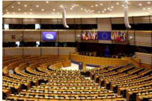
EU-Parlament: Für manche ein Ort der Sehnsucht

Die Sudetendeutschen berührt diese Frage, weil der SL-Vorsitzende, Bernd Posselt, zu den ambitioniertesten Bewerbern für ein Brüssel-Mandat gehört. Er selbst bezeichnete sich noch im Oktober als europäisches Urgestein, aber daran besteht offenbar kein Bedarf mehr, denn in Nürnberg kam er nur auf Platz 10 der Liste. Das ist sogar eine deutliche Herabstufung gegen über 2014 und 2019, als er die Plätze 6 bzw. 7 belegte. Aber wieso kam es zu diesem Misserfolg? An mangelnder Gefolgschaftstreue kann es nicht liegen, denn mit der SL-Satzungsänderung lag er doch innerhalb des Erwartungshorizonts seiner Partei. Nun, in der CSU ist man nicht blind. Herr Posselt hat die erwähnte Satzungsänderung erst nach langem Streit durchgesetzt und weiteste Teile der Landsmannschaft verärgert. Damit kann er auch nur noch wenige Sudetendeutsche für die CSU mobilisieren, und genau das bildet sein zehnter Platz ab.