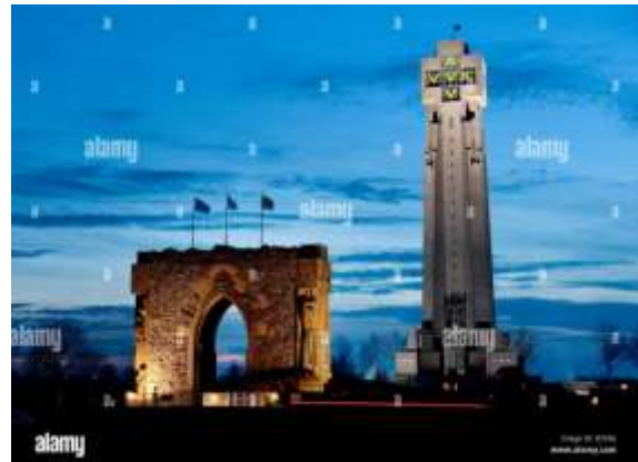
Gedenkstätte Diksmuide (links der Sockel des zerstörten Monument)