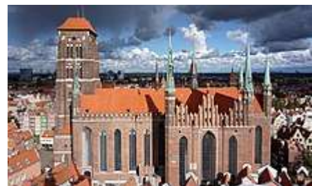
Marienkirche in Danzig