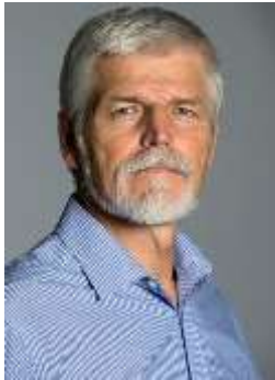
General a.D. P.Pavel

Die Stichwahl um das Präsidentenamt in der ČR gewann General a.D. Petr Pavel. Seine erste Stellungnahme war: „Mögen Wahrheit, Ehre und Würde in unser ganzes Land zurückkehren“. Leider werden solche Worte nie auf die Vertreibung bezogen, wie auch andere Beispiele zeigen.