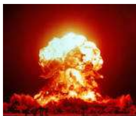
Atompilz 1953, Nevada

Die Warnung vor einem „neuen München“ ist seit Beginn des Ukrainekrieges eine beliebte Argumentationsfigur. Neu ist, dass sie jetzt auch die Kriegsmoral stärken soll, weil „in der Ukraine die Werte Europas“ verteidigt würden. Das wundert allerdings etwas, wenn man an die Aufnahme von Vertreiberstaaten in die „Wertegemeinschaft“ EU oder an die „Korruption auf höchster Ebene“ in der Ukraine denkt (Urteil des Europ. Rechnungshofes, PAZ, 4.11.2022).