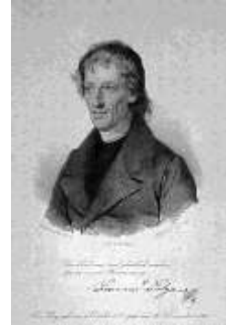
B. Bolzano (1791-1848)

Bolzanos Ziele gingen aber darüber hinaus. Er verstand die Philosophie als Wissenschaft, die die Menschen „weiser und besser“ machen kann. Das ist ein hoher Anspruch, dem nur wenige gerecht werden können (oder wollen). (F.V.)