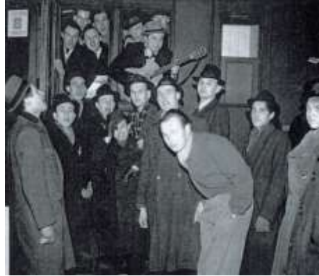
Abreise zum Totaleinsatz im „Reich“

Während des Krieges wurden rd. 600.000 Tschechen zeitweilig dienstverpflichtet. Durch Rotation waren es aber niemals mehr als 280.000 gleichzeitig, viele davon allerdings auch „im Reich“. Diese waren aber keine Zwangsarbeiter, denn sie konnten sich frei bewegen und wurden normal entlohnt. Mit der Deutsch-tschechischen Erklärung des Jahres 1997 wurde diesem Personenkreis pauschal eine Entschädigung von DM 4.000 zugesprochen. Selbst unter den Betroffenen galt das als sehr großzügig. Herr J.Z. schrieb dazu in einem Leserbrief an „Metro“ (11.10.1999): „ Ich war von 1943 bis 1945 in Deutschland „totaleingesetzt“ .... Wir konnten uns frei bewegen, besuchten Theater und Kinos. Ich hatte eine deutsche Freundin, in deren Familie ich freundlich aufgenommen wurde ... Machen wir aus uns keine Häftlinge und Gefangenen! Hören wir auf zu lügen! “