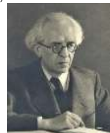
Vojtech Tuka (1941)

Die Geschichte der Tschechoslowakei ist anders abgelaufen. Am 30. Oktober 1918 beschloss die sudetendeutschen Abgeordneten, dass die von ihnen vertretenen und bis zu 94 %