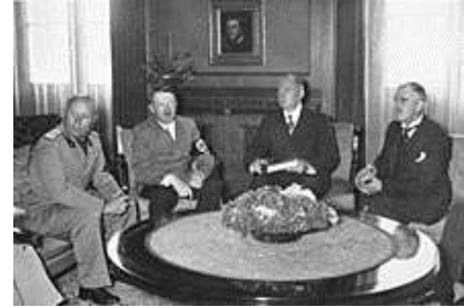
Die „großen Vier“ von München