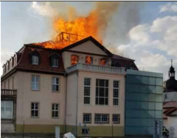
Private Gedenkstätte Guthmannshausen am 24.4.21

Am Abend des 24. April 2021 beschädigte ein Dachstuhlbrand das Gebäude der privaten Gedenkstätte Guthmannshausen in Südthüringen. Da auch die an die Vertreibungsoffer erinnernden Stelen im Park hinter dem Haus beschmiert wurden, geht man von einem Anschlag aus. Der Schaden dürfte bei rd. 1 Mio. Euro liegen.