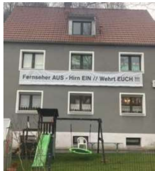
Dieser Querdenker will nicht nur GEZ-Gebühren sparen!

Das alles und vieles mehr durchschauen offenbar mehr Menschen als vermutet, und wenn dann noch corona-bedingte Existenzängste hinzukommen, gehen die Leute eben auf die Straße. Davon können auch Gender-Folklore und identitätspolitische Marotten nicht ablenken. Die Bürger möchten auch einmal das Gefühl haben, dass etwas zu ihren Gunsten beschlossen wird und sie nicht immer wieder neue „Kröten“ schlucken müssen. Das zu wünschen, ist legitim und kein Thema für den Verfassungsschutz! Das Problem sind daher weniger die Demonstranten, sondern eher betriebsblinde Demokratie-Darsteller, wenn sie sich hinter demokratischen Formen verstecken und fragwürdige (oder keine!) Beschlüsse herbeiführen. Sie könnten ihre demokratische Gesinnung zeigen, wenn sie endlich Volksabstimmungen zuließen! Dann wäre das Querdenker-Problem schon fast gelöst! (F.V.).