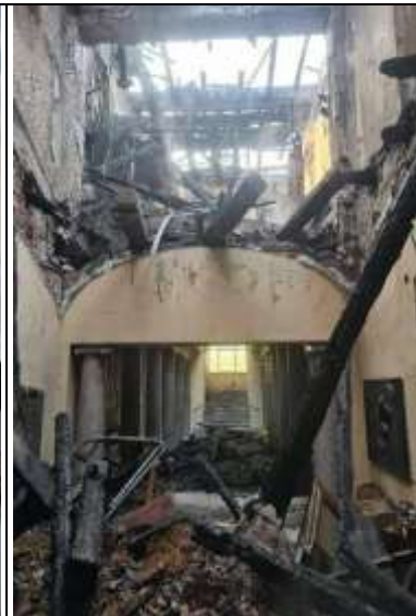
Nach den Löscharbeiten

Spenden an: Wiederaufbau Guthmannshausen, IBAN DE94 8205 5000 0085 0169 42